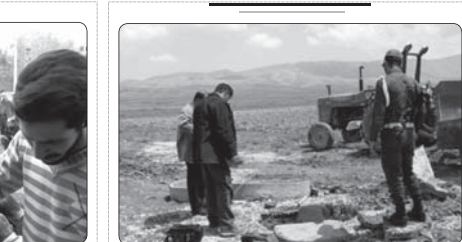
هفت هزار غیرمجاز در شهرستان خماد دستگیر شدند