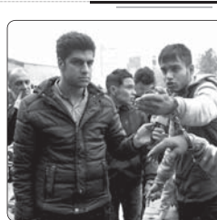
دستگیری ۲۲ نفر از اعزام زنان طایفای در خرمشهر

فرمانده انتظامی شهرستان ملایر از دستگیری قاتل سرقت تعقیب پلیس آگاهی پایتخت با هوشمندی پلیس ملایر خبر داد. سرهنگ پاسدار محمد باقر سلگی در تشریح جزئیات این خبر، گفت: مأمورین کلانتری ۱۲ پاسداران در حین گشت رتی به یک دستگاه خودروی ساروی با دو نفر سرنشین مشکوک شده که بلافاصله طی هماهنگی های قضائی این خودرو را به منظور بررسی دقیق تر به کلانتری منتقل می کنند، در همین ارتباط با حضور اکیبی از پلیس آگاهی در این کلانتری و بررسی های کارشناسی شده کارآگاهان این بگان، مشخص شد راننده به اتهام قتل عمد در بند تهران تحت تعقیب قرار داشته است. این مقام مسئول در ادامه سخنان خود افزود: در انجام تحقیقات فنی و تخصصی فرد مشکوک به قتل ارتکابی اتفاق افتاد که با تشکیل پرونده این قاتل به مراجع قضائی تحویل شد.