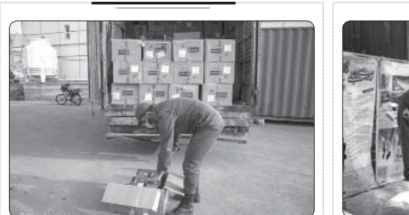
کشف ۱۲۰ میلیارد ریال کالای قاچاق در کیش

فرمانده انتظامی سروستان از دستگیری ۴ نفر از اعضای باند سارقان کلیل برق و مغازه در این شهرستان خبر داد. سرهنگ عبدالرسول مجتهدی در گفتگو با خبرنگار پلیس خبری، در تشریح این خبر بیان کرد: در پی وقوع چندین فقره سرقت کلیل برق در شهرستان سروستان، تحقیق از شاکیان آغاز و محل‌های وقوع سرقت مورد بررسی قرار گرفت. سرهنگ مجتهدی از شهروندان خواست در صورت مشاهده و تردد هرگونه افراد ناانسانی و مشکوک در سطح شهرستان موضوع را در اسرع