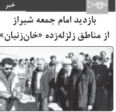
بازدید امام جمعه شیراز از مناطق زلزله زده «خان زینان»

بمانده ولی فقیه در فارس و امام جمعه شیراز با تأکید بر اینکه معامله قرن باید ردانده، بداند که تصویب کرد که ترامپ و ایادی صهیونیستی او در این قمار فلما بازنده خواهند بود.