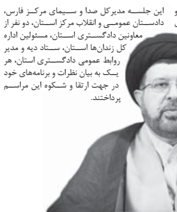
رئیس کل دادگستری فارس: جشن گلریزان آزادی زندانیان در فارس برگزار می‌شود

رکتر فارس و مجوسند و مشم به راه توجه و کمک مردم هستند. عالی‌ترین مقام قضائی استان، فضای معنوی میان مبارک رحمان را فضای مناسبی برای عبادت و تزکیه و انجام اعمال خیر دانست و گفت: آزادی زندانیان نیز از عبادات و امور خیر است. رئیس کل دادگستری فارس در ادامه خاطر نشان کرد: هر سال خیرین فارس در ایام ولادت کریم باب اهل بیت امام حسن مجتبی (ع) با جشنی با شکوه گرد هم جمع می‌شوند تا به زندانیان نیازمند کمک کنند که اسامال با توجه به شیوع ویروس کرونا و لزوم رعایت فاصله گذاری اجتماعی، جشن گلریزان به گونه‌ای متفاوت اما وسیع‌تر برگزار خواهد شد. وی اظهار امیدواری کرد خیرین فارس جشن گلریزان آزادی زندانیان را با شکوه بیشتری برگزار خواهند کرد. این مقام قضائی از برگزاری این جشن با کمک