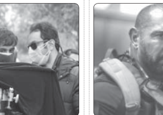
«ارتش مردگان» در ۱۰۰ فیلم پربازدید تفلنکس