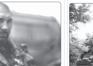
فلینی و تارکوفسکی بر برده جشنواره جهانی فیلم فجر