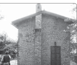
فلینی و تارکوفسکی بر برده جشنواره جهانی فیلم فجر