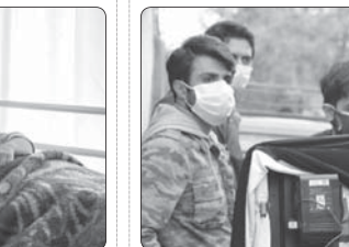
فیلم کوتاه «گوسفند» به نویسندگی و کارگردانی سیدمهران قریشی به مرحله پس تولید رسید