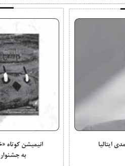
فیلم کوتاه «آت چه» به کارگردانی محمد ترکمند آماده نمایش شد

ترویج و تحکیم اسول و مبانی دینی، فرهنگی تربیتی و دارالقرآن‌ها هستند به‌خصوص اصل مرتفی ولایت فقیه با استفاده از زبان هنر است. معاون پرورشی و فرهنگی آموزش‌وپرورش فارس افزود: تعمیق شناخت، ارتقاء و بازه نگه‌داشتن معارف ولایت علوی و واقعه غدیر خم در اذهان مردم، به‌ویژه نسل نوجوان و جوان، تبیین ابعاد مختلف زندگی و فضائل فردی و اجتماعی و شخصیت‌تعالی حضرت علی (ع)، ترویج فرهنگ و آموزه‌های غدیر با محوریت شخصیت حضرت علی (ع) از دیگر اهداف اجرای این جشنواره فرهنگی و هنری است. وی گفت: معرفی جشنواره فرهنگی و هنری علوی در سطح شهرستان، مدیران پایگاه‌های تابستانی با محوریت کتابخوانی، بوستر، برنامه‌های به‌پسند و مقاله از طریق