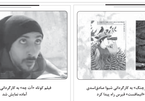
فیلم کوتاه «آت چه» به کارگردانی محمد ترکمند آماده نمایش شد

ترویج و تحکیم اسول و مبانی دینی، فرهنگی تربیتی و دارالقرآن‌ها هستند به‌خصوص اصل مرتفی ولایت فقیه با استفاده از زبان هنر است. معاون پرورشی و فرهنگی آموزش‌وپرورش فارس افزود: تعمیق شناخت، ارتقاء و بازه نگه‌داشتن معارف ولایت علوی و واقعه غدیر خم در اذهان مردم، به‌ویژه نسل نوجوان و جوان، تبیین ابعاد مختلف زندگی و فضائل فردی و اجتماعی و شخصیت‌تعالی حضرت علی (ع)، ترویج فرهنگ و آموزه‌های غدیر با محوریت شخصیت حضرت علی (ع) از دیگر اهداف اجرای این جشنواره فرهنگی و هنری است. وی گفت: معرفی جشنواره فرهنگی و هنری علوی در سطح شهرستان، مدیران پایگاه‌های تابستانی با محوریت کتابخوانی، بوستر، برنامه‌های به‌پسند و مقاله از طریق