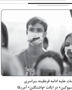
اعتراضات علیه ادامه قریب تمامه سراسری در شهر «اسپوین» در ایالت «واشنگتن» آمریکا

طالبان افغانستان روز دوشنبه مسئولیت حمله به یک مرکز نظامی در ولایت هلمند را پذیرفت که دست کم ۱۵۰ ارتش افغان و شاخه اطلاعاتی در آن مستقر هستند. به نقل از خبرگزاری روتترز، به گفته مقام های دولتی و گروه شبه نظامی طالبان، این حمله یکشنبه شب انجام شد. فرانس بوسف احمدی، سخنگوی این گروه شبه نظامی در بیانیه ای گفت: دهها موقتاً به نیروهای دشمن در این حمله کشته و زخمی شدند. مقام های محلی ولایت هلمند در جنوب افغانستان می گویند حمله از طریق انفجار یک خودروی بمب گذاری شده بوده است.