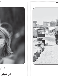
تور ۷ نیروی امنیتی سوریه توسط افراد مسلح ناشناس