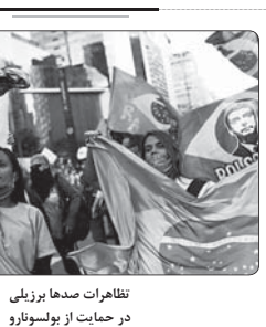
تظاهرات صدها برزیلی در حمایت از بوسونارو