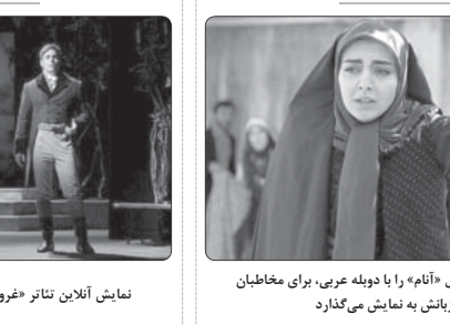
شکبه ای فیلم سریال «انام» را با دوبله عربی، برای مخاطبان عرب‌زبان به نمایش می‌گذارد