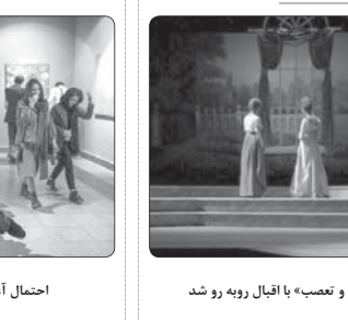
نمایش آنلاین تئاتر «غور و تعصب» اقبال رویه و رش