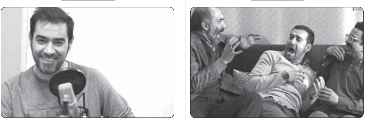
سریال «هویبن» در پایان تصویربرداری