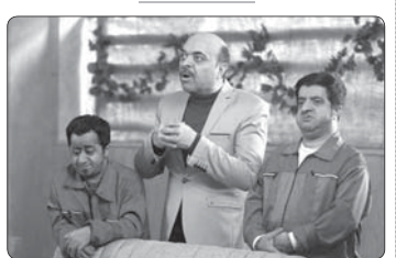
تولید فاز نوروزی «میائبر» در انتظار بودجه