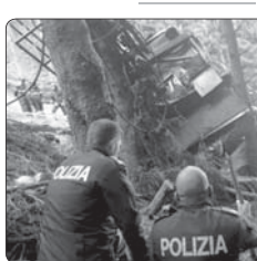
در پی سقوط تله کابین در شمال ایتالیا دستکم ۱۴ جان خود را از دست دادند

فرمانده انتظامی چهارمحال و بختیاری از دستگیری ۳ نفری ۳۰ساله مرگ و کشف ۱۷۶ کیلوگرم تریاک در محور قاقاق بروجن در ۲۴ ساعت گذشته خبر داد. سردار منوچهر امین‌اللهی افزود: گشته‌های یک کسب‌خوری منتهی به فعالیت قاچاقچیان موالعخدر در امر قاقاق بروجن به فعالیت قاچاقچیان مومضخدر در دستور کار پلیس قرار گرفت. مأموران پلیس در هماهنگی با ممل قضایی با زیرپوشش قرار دادند و موالعخدر، موالعخدر، به دستگته خودروی حامل مواد مخدر را متوقف و ۹ کیلوگرم مواد مخدر را دستگیر کردند. به گفته وی، در بازرسی از خودروهای توقیفی ۱۷۶ کیلوگرم موالعخدر از نوع تریاک که به دلیل مالهان‌های در خودروها جاسازی شده بود، کشف شد و متهمان برای سیر مراحل قانونی تحویل مراجع قضایی شدند.