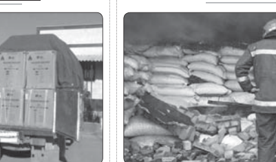
آتش سوزی یک کارخانه پلاستیک در قم