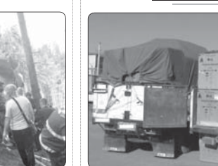
تقریب بیش از ۵ میلیارد ریال لوازم خانگی قاچاق در کنگاور