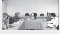
نماینده ولی فقیه در استان فارس گفت: امیدوارم آینده ایران به گونه‌ای باشد که تمام کشورهای اسلامی به برکت حضور مقتدرانه ارتش در آب‌های آزاد دنیا احساس آرامش، امنیت و توانمندی در تعامل با سایر تمدن‌های بشری داشته باشند.

امام جمعه شیراز: حضور مقتدرانه «نداجا» در آب‌های آزاد امنیت کشورهای اسلامی را تضمین می‌کند