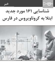
شناسایی ۱۶۱ مورد جدید ابتلا به کروناویروس در فارس

معاون بهداشت دانشگاه علوم پزشکی شیراز از شناسایی ۱۶۱ مورد جدید ابتلا به کرونا ویروس در استان فارس خبر داد.