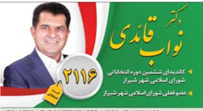
کاندیدای ششمین دوره انتخاباتی شورای اسلامی شهر شیراز

دوشنبه ۲۴ خرداد ۱۴۰۰ فی القعه ۱۴۴ ژوئن ۲۰۲۱ شماره ۴۴۵۵ قیمت ۶۰۰۰ تومان