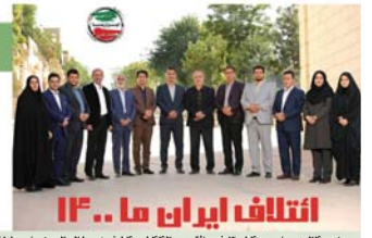
انتخاب ایران ما ۱۴

دوشنبه ۲۴ خرداد ۱۴۰۰ فی القعه ۱۴۴ ژوئن ۲۰۲۱ شماره ۴۴۵۵ قیمت ۶۰۰۰ تومان