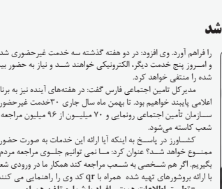
مدیرکل تامین اجتماعی غیر حضوری شد

میرکل پشتیبانی امور دام استان فارس در رابطه با انتظار کاهش قیمت مرغ در بازار گفت: با توجه به اینکه فرایند تأمین و توزیع نهادهای در هفته‌های اخیر نسبت به گذشته وضع مناسب تری پیدا کرده و جوهره زیرسی در این ماه به حدود ظرفیت تولید در استان رسیده، ایچورسجه ما با برنامه‌ریزی و نظارت دقیق‌تر، قیمت مرغ طی روزهای آینده متعادل گردد، رحمانی افزود: براساس صوبات کارگروه تنظیم