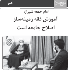
امام جمعه شیراز: آموزش فقه زمينه‌ساز اصلاح جامعه است

نماینده ولی فقیه در استان فارس و امام جمعه شیراز تاکید کرد اگر می خواهید رفتار افراد جامعه را اصلاح کرد باید فقه را با ظرافت و لطافت آموزش دهید؛ در حالیکه به جای آموزش فقه، سراغ ترویج مباهات عرفی می روند.