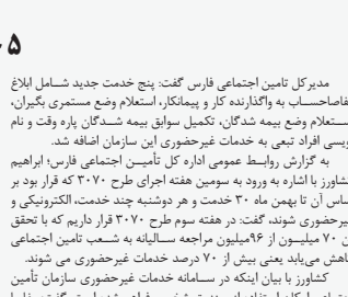
مدیرکل تامین اجتماعی فارس گفت: پنج خدمت جدید شامل ابلاغ مفاصحا حساب به واکاژنده کار و بیمه‌گذار، استعلام وضع بیمه شدگان، تکمیل سوابق بیمه شدگان بار وقت و نام نوسی افراد تبعی به خدمات غیرحضوریی این سازمان اضافه شد.

گفتنی است با توجه به شرایط فعلی کرونا، و برگزاری جلسات به صورت ویدئو کنفرانس، و لوح تقدیر و هدایای مربوطه از طریق سازمان فرهنگی، اجتماعی و ورزشی شهرداری شیراز برای تقدیر شهروندان اقدام می‌شود.