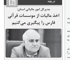
مدیرکل امور مالیاتی استان فارس با بیان اینکه طبق قوانین مالیاتی، در صورت ارائه اسناد لازم موسسات قرآنی از پرداخت مالیات معاف هستند اظهار کرد: اگر یک موسسه قرآنی مالیات اخذ ندهد، است. آن را پیگیری می‌کنیم.

میرکل پشتیبانی امور دام استان فارس در رابطه با انتظار کاهش قیمت مرغ در بازار گفت: با توجه به اینکه فرایند تأمین و توزیع نهادهای در هفته‌های اخیر نسبت به گذشته وضع مناسب تری پیدا کرده و جوهره زیرسی در این ماه به حدود ظرفیت تولید در استان رسیده، ایچورسجه ما با برنامه‌ریزی و نظارت دقیق‌تر، قیمت مرغ طی روزهای آینده متعادل گردد، رحمانی افزود: براساس صوبات کارگروه تنظیم