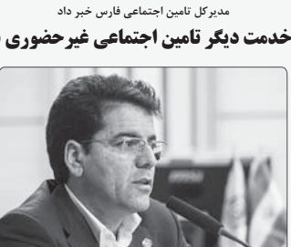
مدیرکل تامین اجتماعی غیر حضوری شد

میرکل پشتیبانی امور دام استان فارس در رابطه با انتظار کاهش قیمت مرغ در بازار گفت: با توجه به اینکه فرایند تأمین و توزیع نهادهای در هفته‌های اخیر نسبت به گذشته وضع مناسب تری پیدا کرده و جوهره زیرسی در این ماه به حدود ظرفیت تولید در استان رسیده، ایچورسجه ما با برنامه‌ریزی و نظارت دقیق‌تر، قیمت مرغ طی روزهای آینده متعادل گردد، رحمانی افزود: براساس صوبات کارگروه تنظیم