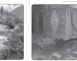
سپیل در خلخال ۴۱۵ میلیارد ریال خسارت بر جای گذاشت

محل کار شیفت بماند. من کار مهمی کاشتم و حتماً باید می رفتم از منزل خرواستم. شیفت را او به عهده بگیرد و در عوض یک روز دیگر من جای او شیفت می ماندم. عروس او قبول نکرد و گفت روز استراحتش است و نمی خواهد روزش را با شیفت خراب کند. هر چه اصرار می کردم که به خاطر من آن شیفت را بماند و قبول نمی کرد. منتهم نوجوان گفت، ستر اینگیرو او شیفت بماند. دعوایمان شد و روزی زود درگیر لفظی ما منجر