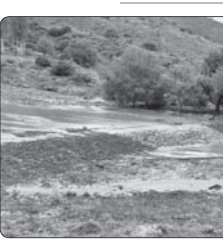
سپیل در خلخال ۴۱۵ میلیارد ریال خسارت بر جای گذاشت

عنوان داشت: مأموران سرریما ضمن هماهنگی با مقام قضایی به محل مورد نظر اعزام و موفق شدند سواری کرایسلر فاقد مدارک گمرکی را توقیف کنند. رئیس پلیس امنیت اقتصادی استان با بیان اینکه برابر نظر کارشناسان ارزش این خودرو، ۱ میلیارد ریال برآورد شده است، گفت: در این خصوص پرونده تشکیل و تحویل مراجع قضایی شد.