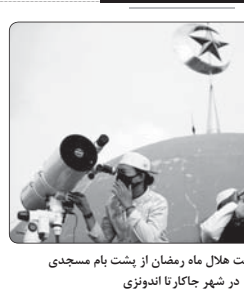
تلاش برای رویت هلال ماه رمضان از پشت بام مسجدی در شهر جاکارا تا اندونزی

رئیس جمهوری با تقدیر از تلاش های همه کارکنان و مدیران وزارت ارتباطات و فناوری اطلاعات، در ادامه سفری ریاست جمهوری توسعه و کارآمدی دولت الکترونیک در کشور، بر گسترش پیش از پیش همکاری همه دستگاه ها در صورت این امکان تاکید کرد. حجت الاسلام والمسلمین «حسن روحانی» روز جمعه در گفتگو با «محمدحسود آذری جهرمی» وزیر ارتباطات و فناوری اطلاعات، با تاکید بر اینکه همه دستگاه ها موظف به همکاری به پیش از پیش در زمینه توسعه دولت الکترونیک در کشور هستند، گفت: توسعه دولت الکترونیک نیازی حیاتی برای کشور بوده و هر روز ضرورت نیاز به آن در فعالیت دستگاه های دولتی قایل مشاهده است. وی با اشاره به لزوم تلاش برای توسعه همه جانبه دولت الکترونیک در سراسر کشور، پرداخت ۱۷ میلیون قیلم بودن کل بودن یک برنامه حصری به بانکها در از آزمون بزرگ کارآمدی دولت الکترونیک و ادامه دادن زیرساختها عنوان کرد. رئیس جمهوری افزایش سرعت اینترنت را موضوعی حائز اهمیت شمرد و اظهار داشت: امروز زندگی مردم با فضای مجازی و ارتباطات توسعه یافته و باید در این راستا اهتمام لازم را داشته باشیم. وزیر ارتباطات نیز در گفتگو با کارکنان و مدیران وزارت ارتباطات و فناوری اطلاعات، بر برنام ریزی ها و تلاش های انجام شده در این باره تاکید کرد. رئیس جمهوری همچنین برای کارآمدتر شدن دولت الکترونیک، افزایش سرعت اینترنت و افزایش ارائه خدمات به مردم در این حوزه ارائه کرد.