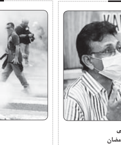
اعراض پزشکیان پاکستانی به بازگشایی مساجد در ماه رمضان