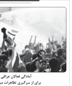
یک کشته در اعتراض علیه معدهها در وژونولا