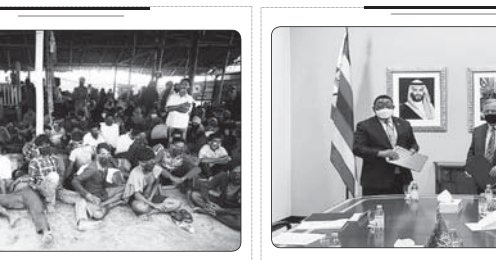
پیش از ۱۶۰۰ روهینجایی به یک جزیره دورافتاده در بنگلادش منتقل شدند

خوشبختانه برای روستاها کارهای بزرگ و خوبی انجام شده است. روحانی با بیان اینکه بهبود راندمان بودجه برای ما بسیار اهمیت است، افزود: درست است ۲۵۰۰ مگالون برقی تولید و نیروگاه جدید تأسیس کردیم اما رقم بالای ۴۰۰۰ مگالون برقی مجازی هم ایجاد شد و با کمک مردم و تغییر سامات استفاده از برقی توانسیم از سرمایه گذاری های غیر ضروری بی نیاز شویم. وی گفت: رشد مصرف برقی در سال های ۵ درصد و اسیال یک درصد بود و این یعنی مردم همکاری کردند. رئیس جمهور با اشاره به طرح دولت برای رایگان کردن برق مشترکان کم مصرف، گفت: مسائل دیگری که دولت به دست می دهد، باید بحت طرح برقی امید بود که تا پایان آذر اعلام می شود، انهایی که کم مصرف باشند از دادن پول برق معاف می شوند. این هدیه کوچکی است از سوی دولت که صرفه جویی را به مردم کامل مدنظر قرار می دهد. روحانی در ادامه تصریح کرد: دولت اگر موفقیتی به دست