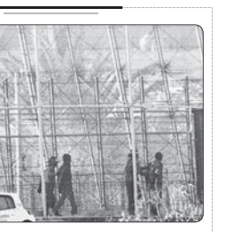
انهدام یک گروهک تروریستی خطرناک وابسته به داعش در عراق