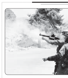
سربوک وحشیانه تظاهرات فلسطینی ها در کرانه باختری

وزارت خارجه اردن از دیدار وزیر خارجه این کشور با همنای صهیونیستی خبر داد. به نقل از سایت انترنشر، وزارت خارجه اردن در بیانیه ای اعلام کرد که ایمن الصفدی، وزیر خارجه این کشور با گابنی اسکاتلندی، وزیر خارجه دولت رژیم صهیونیستی در منطقه «کریه الینی» واقع در نرزدن و اراضی اشغالی فلسطین دیدار و گفت و گو کرد. طبق این بیانیه وزیر خارجه اردن و رژیم صهیونیستی در این دیدار درباره تحولات مربوط به از سرگیری مذاکرات میان این رژیم و فلسطین راینی کردند. الصفدی در این دیدار بر ضرورت از سرگیری مذاکرات میان رژیم صهیونیستی و فلسطین بر اساس قانون بین الملل و ایجاد خودمأندار واقعی برای تحقق صلح عادلانه میان آنها تأکید کرد.