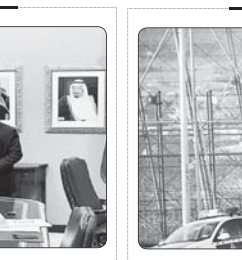
عربستان و رژیم یوایه روابط دیپلماتیک برقرار کردند

خوشبختانه برای روستاها کارهای بزرگ و خوبی انجام شده است. روحانی با بیان اینکه بهبود راندمان بودجه برای ما بسیار اهمیت است، افزود: درست است ۲۵۰۰ مگالون برقی تولید و نیروگاه جدید تأسیس کردیم اما رقم بالای ۴۰۰۰ مگالون برقی مجازی هم ایجاد شد و با کمک مردم و تغییر سامات استفاده از برقی توانسیم از سرمایه گذاری های غیر ضروری بی نیاز شویم. وی گفت: رشد مصرف برقی در سال های ۵ درصد و اسیال یک درصد بود و این یعنی مردم همکاری کردند. رئیس جمهور با اشاره به طرح دولت برای رایگان کردن برق مشترکان کم مصرف، گفت: مسائل دیگری که دولت به دست می دهد، باید بحت طرح برقی امید بود که تا پایان آذر اعلام می شود، انهایی که کم مصرف باشند از دادن پول برق معاف می شوند. این هدیه کوچکی است از سوی دولت که صرفه جویی را به مردم کامل مدنظر قرار می دهد. روحانی در ادامه تصریح کرد: دولت اگر موفقیتی به دست