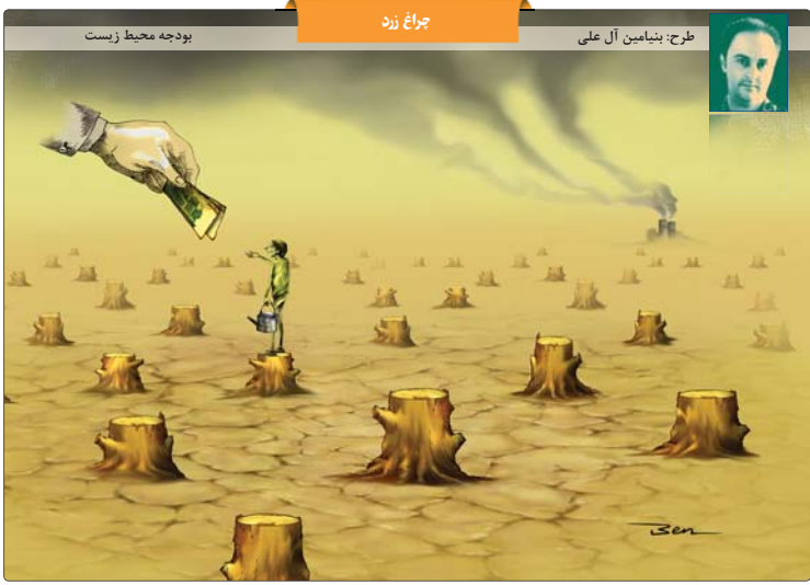
طرح: بنیامین آل علی | چوچ زند | بودجه محیط زیست

دوشنبه ۱۷ آذر ۱۳۹۹ رتبه الی ۲۱ و رتبه الی ۱۴۴۲ دسامبر ۲۰۲۰ شماره ۶۳۱۳