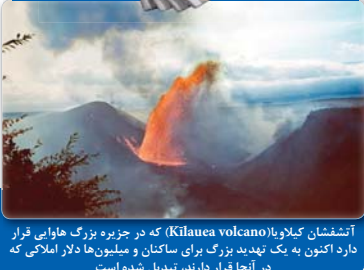
آتشفشان کیلاوا (Kilauea volcano) که در جزیره بزرگ هاوایی قرار دارد اکنون به یک دیدنی بزرگ برای ساکنان و میلیون‌ها تالار املاکی که در آنجا قرار دارند، تبدیل شده است