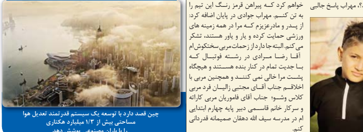
چین قصد دارد با توسعه یک سیستم قدرتمند تعدیل هوا مساحتی بیش از ۱/۳ میلیارد هکتاری را با باران مصنوعی پوششی دهد