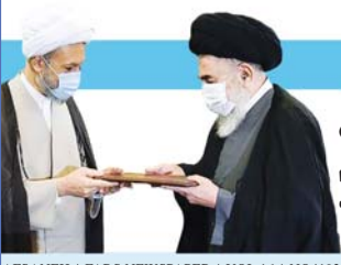
حکم تولیت آستان شاهچراغ (ع) به آیت الله لطف الله دزگام اعطا شد

AFSANEH * FARS NEWSPAPER * VOL 16 * NO4192