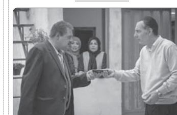
بخش سریال کمدی «دوکتس ۲» به کارگردانی برزو نیک‌نژاد از سه شبیه هشتم تیرماه آغاز می‌شود