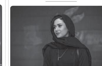
«ملات خانومی» به کارگردانی امید شمس با حضور پریناز ایزدیار به زودی در تهران کلد می‌خورد