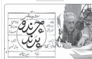
«جورد و برند» هنر صیحه‌گای رادیو نمایش شد