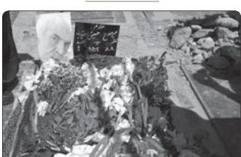
خاکسپاری میرصلاح حسینی در نوع نماز الله گرجی

پذیرفته‌اند، اما نکته این است که تنها فیلم‌های معیف قضائتی ایران هستند که سینماهای ایران فیلم‌ها را برای اکران تایید نمی‌کنند و یک سری فیلم‌ها وجود دارد که سینماها «ملاقمه» به اکران آن هستند اما متأسفانه صاحبان فیلم‌ها تمایلی به اکران این آثار ندارند. ختمی گفت: ممکن است حمایت ۲ و نیم میلیاردی رقم خوبی باشد، اما فیلمی که تهیه‌کننده آن اعتماد دارد ۲۰ میلیارد در شرایط عادی فروش دارد، اگران با این سوئید سفر است، در این شرایط ما پذیرفته‌ام که فیلم سینمایی «دینامیت» (اکران کنیم، اما نزدیک به یک هفته است که گفت‌وایم که یک ضمانت کلی برای حمایت از فیلم ما به بند. وی توضیح داد: درواقع کار دولت فعلی به پول، رسیده است و حتی ضمانتی وجود ندارد که دولت مرکزی برای کار بایدها و این حمایت اگریزی شود. در واقع سینمای ایران در این تصمیم گیری های دولتی دچار مشکل شده است.