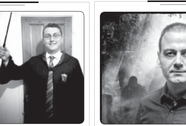
مهرکزاد: «پاییز در قطار» اثر محمد ظلم زبانی در چارچوب طرح کتاب سازمان فرهنگ و ارتباطات اسلامی به زبان تامیلی ترجمه و منتشر شد...