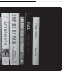
مهرکزاد: «پاییز در قطار» اثر محمد ظلم زبانی در چارچوب طرح کتاب سازمان فرهنگ و ارتباطات اسلامی به زبان تامیلی ترجمه و منتشر شد...