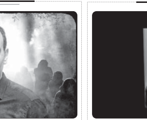
مهرکزاد: «پاییز در قطار» اثر محمد ظلم زبانی در چارچوب طرح کتاب سازمان فرهنگ و ارتباطات اسلامی به زبان تامیلی ترجمه و منتشر شد...