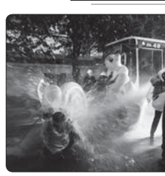
سیر معترضان دموکراسی خواه تاباند در برابر ماشین آب‌پاش پلیس اتانکو

شورای امنیت سازمان ملل خواستار تشکیل هرچه سریع‌تر دولت لبنان و انجام اصلاحات در این کشور شد. به نوشته روزنامه القدسی العربی، بیان کوپیس، هماهنگ‌کننده ویژه سازمان ملل در لبنان پس از نشست شورای امنیت درباره لبنان در روز دوشنبه نوشت: گزارشی را درباره اوضاع لبنان به شورای امنیت ارائه و تلاش کرده تا حمایت اعضا از این کشور و آن را که با بحران چندجانبه مواجه هستند، جلب کند. وی در بیان فعالیت‌ها به مقابل پیام شورای امنیت و رهبران لبنان اکتفا به تشکیل دولت لبنان نوشت. دولت بود هیچ‌یک از اعضای شورای امنیت که دولت کراآمد و قادر به انجام اصلاحات و تغییر در لبنان دولتی که علیه فساد و برای تحقق عدالت و شفافیت کار کند.