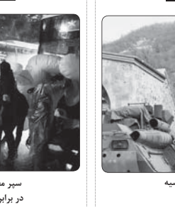
استقرار نیروهای حافظ صلح روسیه در قرق‌باغ

مسئله‌ها و متفلسف نیز به وضوح صحبت کرده‌ایم. ظرفیت افزود: از دید یک و نیت مستقیم دولت افغانستان در خصوص توسعه و گسترش روابط با ایران آگاه هستیم و از این سلسله‌گزارتی‌ها و ادامه داد: ما آمادگی کامل برای افزایش خط‌ای حواف - حرزات ایران داریم. ما در صورتی که خود مشکل ایجاد نکنند این افتتاح خوبی خواهد بود. میسین، ناب معلوم و سیاسی وزارت خارجه افغانستان ضمن ابراز