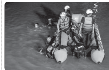
غرق شدن ۱۱ دانش آموز اندونزیایی در زمان باکساری رودخانه