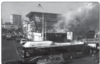
یک مرکز تجاری در باکو طعمه حریق شد