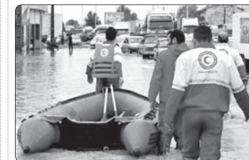
امداد رسانی هلال احمر به ۳۲۰ حادثه دیده در سراسر کشور در ۷۲ ساعت گذشته