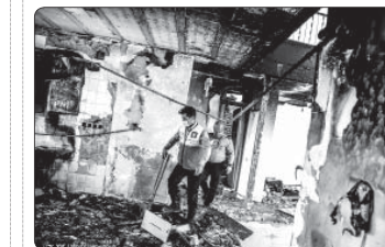
وقوع آتش سوزی در یک واحد مسکونی واقع در کامرانیه تهران