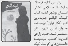
رئیس اداره فرهنگ و ارشاد اسلامی دشتی

گفت: این کتاب با قیمت ۱۰۰۰ هزار تومان در ۱۰ نسخه انتشارات تاملو موفقت یلانی تهران به چاپ رسیده است. دشتی مدیریت مالی دانشگاه کازرون در حال نوشتن است.