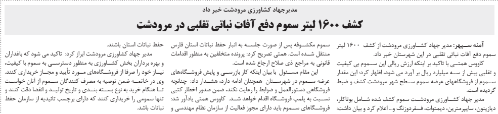
مدیرجهاد کشاورزی مرودشت خبر داد

مدیرکل هوشناسی خوزستان گفت: از روز چهارشنبه به دفعه ووقع دهههای ۴۹ و ۵۰ درجه و بالاتر در برخی از مناطقی است. وی اظهار داشت: تا روز شنبه برداشت محصول سیب زمینی افزایش است و طرحی در برخی از مناطق جنوبی، غربی و مرکزی خواهد شد.