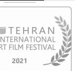
۶ هزار ۴۰۲ فیلم خارجی برای رقابت در سی‌وهشتمین جشنواره بین‌المللی فیلم کوتاه تهران ثبت‌نام کردند