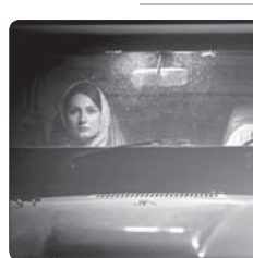
فیلمبرداری فیلم کوتاه «مئل سنگ» به پایان رسید

سریال «عاشورا» با بازی «عاشورا» که از زمستان خردادماه بازی کرد. این پروژه را سال‌ها در حال آماده‌سازی و کوشش‌های مربوط به جزیره محزون ۲۰۰۰ درصد از این سریال تصویربرداری شده است و هادی جزایری علاوه بر کارگردانی و نویسندگی این اثر، نقش شهید مهدی باکری را هم بازی می‌کند. روحه زمانی بازیگر فیلم «خورشید» مجید در این سریال نقش جویباری شهید خرم ملزاده را ایفا می‌کند و سزای او همچنان در این پروژه ادامه دارد. این سریال زندگی و شهادت مهدی و حمید باکری را محور داستان قرار داده است و همچنین به رشادتهای و لشکر ۳۱ عاشورا در عملیات خیبر و بدر می‌پردازد.