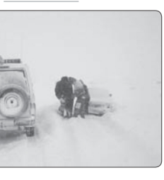
واگونی خودرو حامل اتباع بیگانه در راین