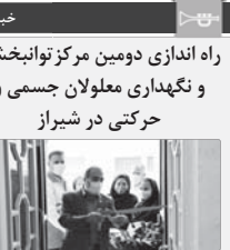
راه اندازی دومین مرکز توانبخشی و نگهداری معلولان جسمی و حرکتی در شیراز

دومین مرکز توانبخشی و نگهداری افراد دارای معلولیت جسمی و حرکتی فارس، در ششمین روز از هفته بهرینستی در شیراز افتتاح شد.