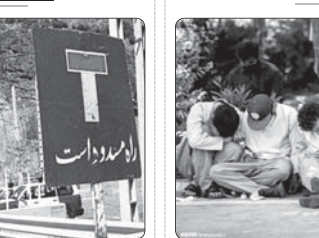
دستگیری ۱۲ سارق داخل خودرو و موتورسیکلت در ملایر