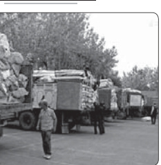
کشف محموله پارچه قاچاق ۵۱۰۰میلونی در تهران