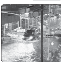
طوفان آبدآ منجر به مرگ دهها نفر در شمال شرق آمریکا شد