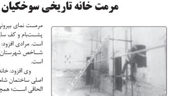
مرحله جدید مرمت خانه تاریخی سوخکیان داراب آغاز شد. مسئول اداره میراث فرهنگی، گردشگری و صنایع دستی شهرستان داراب گفت: در این طرح...

وی افزود: خانه سوخکیان داراب یکی از بخش اصلی ساختمان شامل حیاط اندرونی و بیرونی و بخش حمامی است. همچنین منطبق در ضلع جنوب غربی و ضلع قدیمی در ضلع جنوب شرقی حیاط داراب در طبقه اول از کف سربلندی خانه بوده است. از دیگر فضاهای این بنای تاریخی محسوب می‌شود. این خانه تاریخی به شمله ۴۶۷۹ در فهرست آثار ملی کشور به ثبت رسیده است.