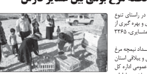
مدیرکل امور عشایر فارس گفت: در راستای توزیع ۳۳۶۵ قطعه مرغ بومی توسط مرغ پروری بومی توزیع شد.

مدیرکل امور عشایر فارس، وی افزود این مجموعه توسط اداره دامپزشکی این اداره کل تهیه در میان اعضای صندوق های خرد زنان و زنان سرپرست خانوار توزیع شده است. مدیرکل امور عشایر فارس اظهار داشت: توزیع این تعداد مرغ بومی از عوامل تامین کننده است. توزیع های موجود از جمله اهداف این طرح بوده است.