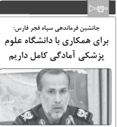
جانشین فرماندهی سپاه فجر فارس: برای همکاری با دانشگاه علوم پزشکی آمادگی کامل داریم

سردار بوعلی گفت: سپاه فجر فارس از زمان بروز بیماری کرونا با فعالیت کردن تیم های مختلف کارشناسی و عملیاتی و در کنار سایر نهادهای مسئولان استان اقدامات بسیار خوبی در راستای افزایش تولید اقلام بهداشتی و پزشکی داشته است. جلسه فرارگه پیشگیری و مقابله با بیماری کرونا با حضور سردار عبدالله بوعلی، مسئولین سپاه فجر و فرماندهان سپاه استان فارس برگزار شد. سردار بوعلی در این جلسه با استاندار و کادر بیمارستان های خدمات پوشکان، پرستاران و کادر بیمارستان های استان فارس در راستای مقابله با بیماری کرونا و افزایش تولید اقلام بهداشتی و پزشکی داشته است. جلسه فرارگه پیشگیری و مقابله با بیماری کرونا با حضور سردار عبدالله بوعلی، مسئولین سپاه فجر و فرماندهان سپاه استان فارس برگزار شد. سردار بوعلی در این جلسه با استاندار و کادر بیمارستان های خدمات پوشکان، پرستاران و کادر بیمارستان های استان فارس در راستای مقابله با بیماری کرونا و افزایش تولید اقلام بهداشتی و پزشکی داشته است. جلسه فرارگه پیشگیری و مقابله با بیماری کرونا با حضور سردار عبدالله بوعلی، مسئولین سپاه فجر و فرماندهان سپاه استان فارس برگزار شد. سردار بوعلی در این جلسه با استاندار و کادر بیمارستان های خدمات پوشکان، پرستاران و کادر بیمارستان های استان فارس در راستای مقابله با بیماری کرونا و افزایش تولید اقلام بهداشتی و پزشکی داشته است.