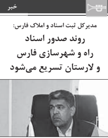
مدیرکل ثبت اسناد و املاک فارس: